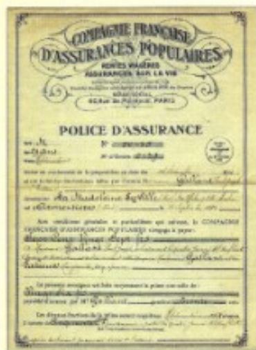
Une police de 1912